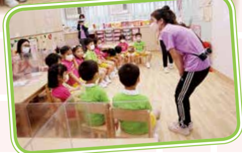
All the teachers did reflection and evaluation for the free play 大家一起探討和反思幼兒進行自由遊戲的情況