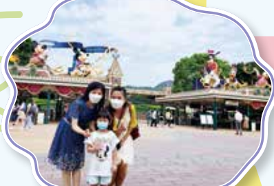
Let's take a photo for keeping memory 快樂的時間亦不忘拍照留念