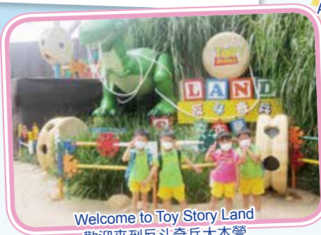
Welcome to Toy Story Land 歡迎來到反斗奇兵大本營