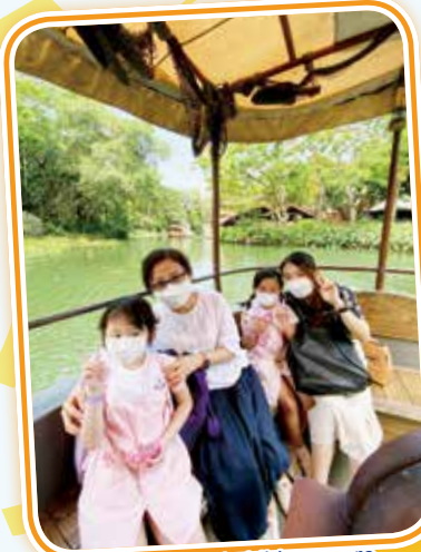
Teachers and children were having fun on the boat 老師和小朋友都樂在其中