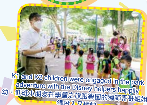
K1 and K2 children were engaged in the park adventure with the Disney helpers happily 幼、低班小朋友在學習之旅跟樂園的導師哥哥姐姐玩得投入又愉快