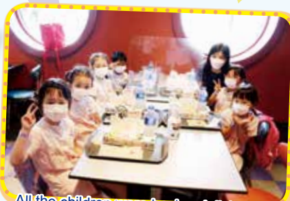
All the children were having delicious lunch at the Starliner Diner 小朋友一起在火箭餐廳享受豐富又美味的兒童午餐

高班小朋友的大日子來到了！為了擴闊幼兒的視野及增強親子間的溝通，並讓畢業生留下一段美好而難忘的回憶，學校終於在6月7日舉辦高班迪士尼畢業慶典。高班的小朋友、校長、主任、老師及家人都懷著興奮和期待的心情到迪士尼與米奇愉快地拍下畢業照。