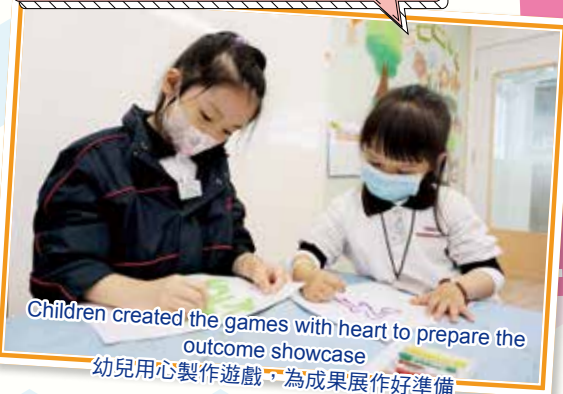
Children created the games with heart to prepare the outcome showcase 幼兒用心製作遊戲，為成果展作好準備