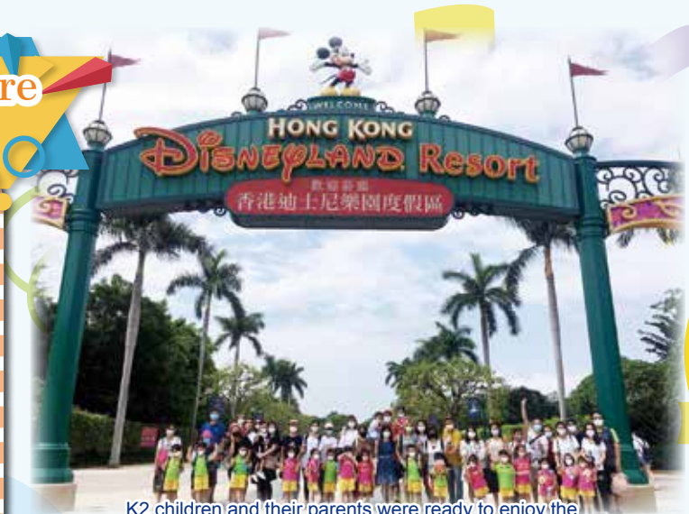
K2 children and their parents were ready to enjoy the time in Disneyland 每位K2小朋友和家長已預備好享受遊覽迪士尼了

在這既難忘又具紀念價值的一天，幼、低班的小朋友能參與有趣好玩的學習之旅。於是次活動中，幼兒班的幼兒可攜帶著「迪士尼探索之旅全方位錦囊」，並由家長帶領他們於香港迪士尼樂園探索樂園四大主題。而低班的幼兒則置身奇妙場景，在歡樂的音樂氣氛下學習趣味十足的說故事技巧，發揮無限創意。