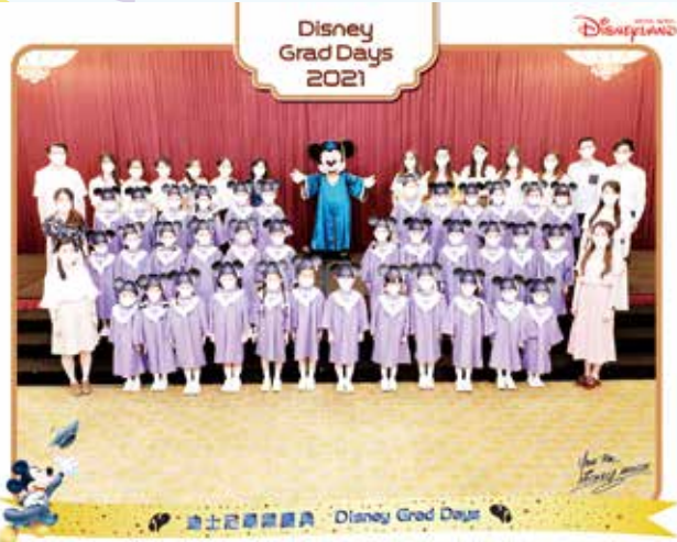
Look at how upright and energetic the K3 graduates were 看看各位高班的畢業生站立得多麼筆直和精神奕奕