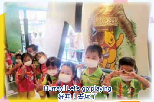
Hurray! Let's go playing 好哇！去玩了