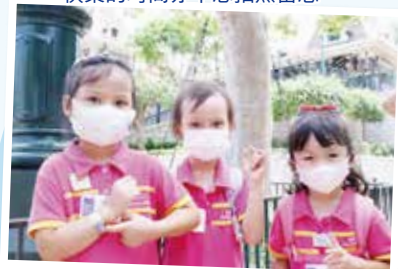
321, Smile! 三二一，笑！