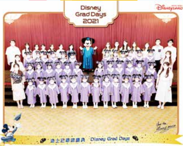
Every K3 child had put on the grand graduation gown and mortarboard to take photo with Mickey 高班的小朋友都穿上華麗的畢業袍和戴上畢業帽與米奇拍下照片