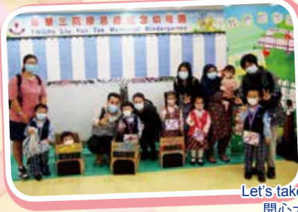
Let's take a photo 開心大合照