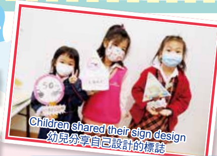
Children shared their sign design 幼兒分享自己設計的標誌