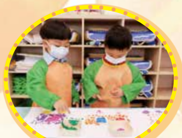
The Railway World in my eyes 我眼中的鐵路世界