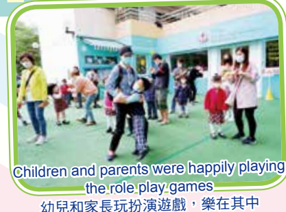
Children and parents were happily playing the role play games 幼兒和家長玩扮演遊戲，樂在其中