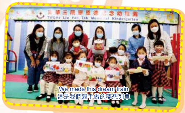
We made this dream train 這是我們親手做的夢想列車