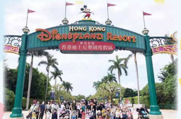
All the K1 children and parents were excited and got ready to get in the park 小朋友和家長們都很興奮並準備進入樂園遊玩