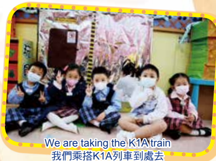
We are taking the K1A train 我們乘搭K1A列車到處去