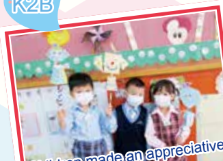
Children made an appreciative and playful creation 幼兒製作了可欣賞又能玩的藝術作品