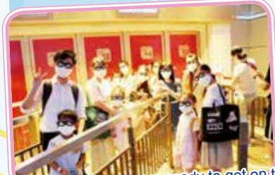
It seemed that everyone were ready to get on the flight with Iron Man 看來大家已準備登上鐵甲號