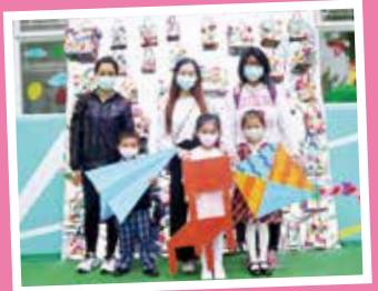
What an interesting game 紙橋真好玩