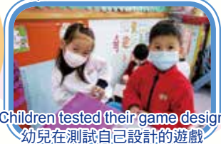
Children tested their game design 幼兒在測試自己設計的遊戲