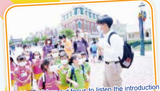
All of the children put focus to listen the introduction from the Disneyland helper 大家都專心聆聽迪士尼導遊哥哥的介紹