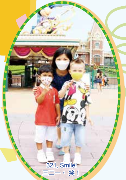
321, Smile! 三二一，笑！