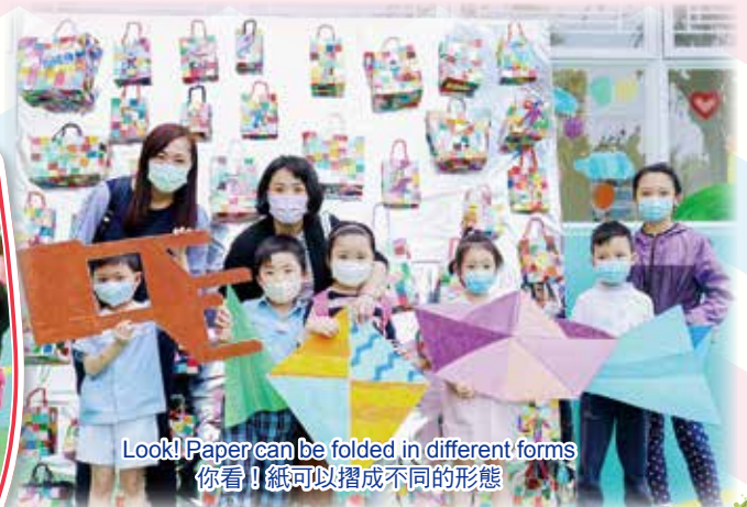
Look! Paper can be folded in different forms 你看！紙可以摺成不同的形態