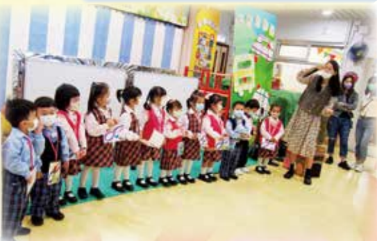
Our performance was very nice 我們的表演很精彩