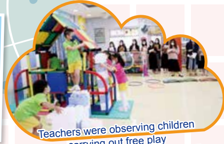
Teachers were observing children carrying out free play 大家觀察著幼兒進行自由遊戲的情況